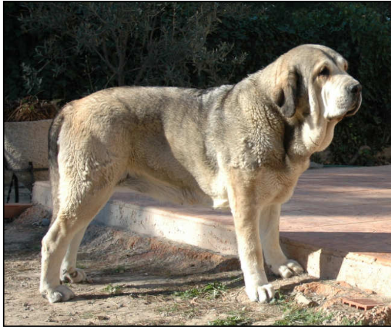
FIORA DEL AGOSTADERO

Elástica, gruesa, abundante y de color rosáceo, con pigmentaciones más oscuras. Todas las mucosas serán negras.